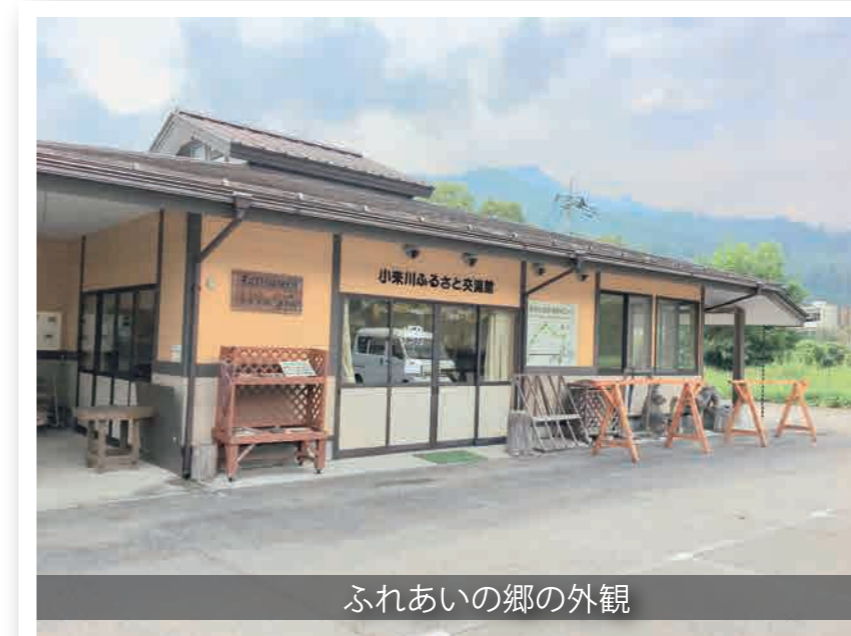
ふれあいの郷の外観