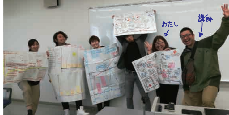
同じ班のメンバーと講師の方

協力隊2年目～3年目の隊員に向けたステップアップ研修が滋賀県で行われ、1泊2日で参加してきました。基本的に協力隊の任期は3年間（日光市は独自制度で2年延長できます）のため、参加している隊員の方のほとんどがあと1年ほどで卒業します。活動の集大成とも言える時期をどう過ごしていくか、任期後の進路はどのようにするのかなど、それらを『ロードマップ』という人生設計のようなものを自分で作りながら可視化し、今後の活動や進路の参考にしていこう、という研修でした。