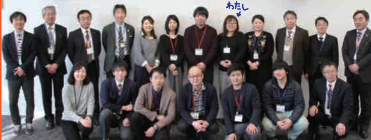
協力隊・担当職員の記念撮影