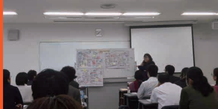
研修生の前で発表する私