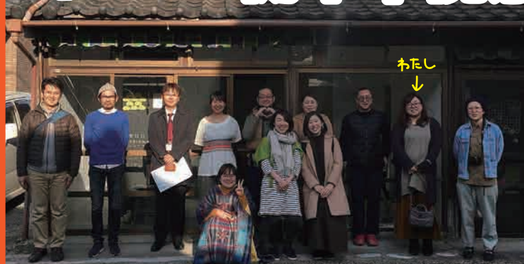
視察が異業種交流会に発展