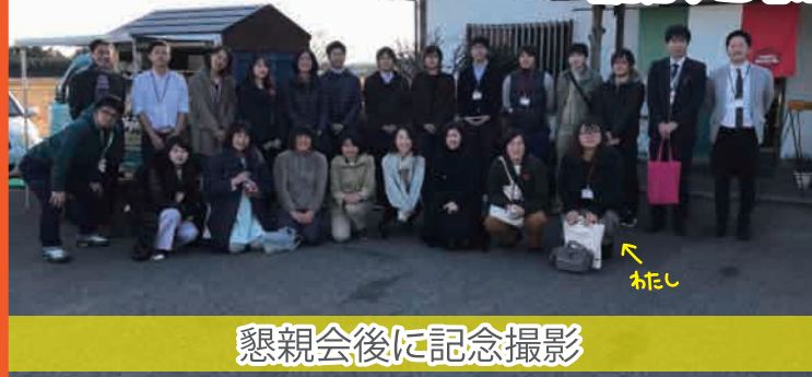
懇親会後に記念撮影