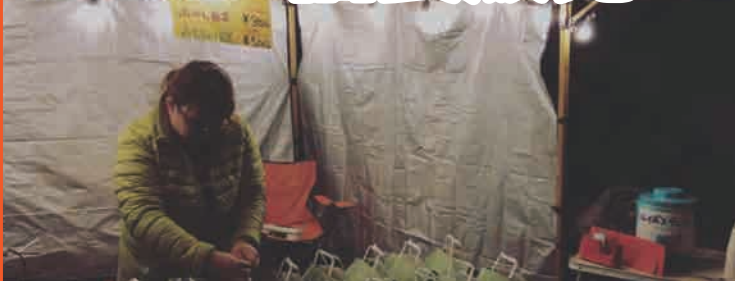
テント内で福袋を販売する様子

円光寺さんの駐車場をお借りし、駄菓子の福袋を販売させていただきました。寒い中、たくさんの方にお声をかけていただきありがとうございました！