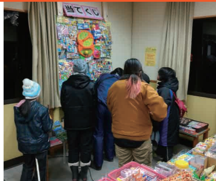
駄菓子屋に来てくれた皆さん

中小来川のどんど焼きを見学しました。いつも駄菓子屋に買いに来てくれる子供たちからのお願いもあって、当日の夜は駄菓子屋を開店。沢山の子供たちが遊びに来てくれました！当日はチョコマシュマロを無料配布。子供たちは木で作られた剣の先にマシュマロを取り付け、どんど焼きの火であぶり、溶かして食べていました。パチパチドンドンという大きな音が小来川の山々に反響していて、山が近くて静かな小来川ならではの現象だなと感じました。