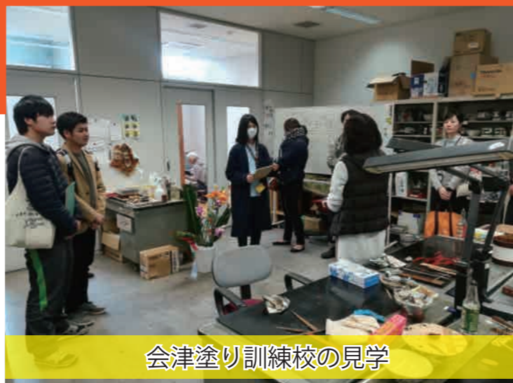
会津塗り訓練校の見学