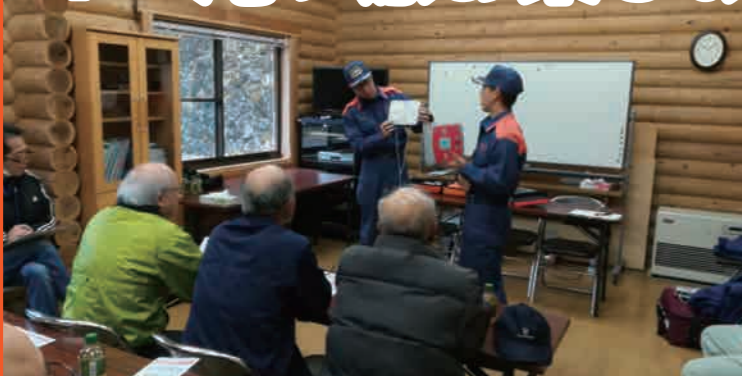
日光消防署による応急処置の説明