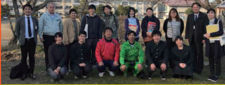
会津農林高校のみなさんと

日光市の協力隊6名と地域振興課の職員2名の計8名で福島県に視察研修に行きました。