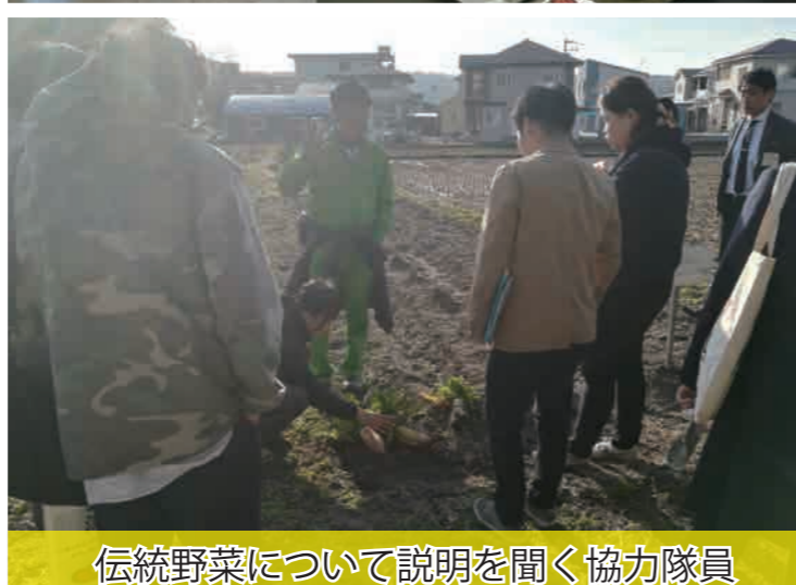
伝統野菜について説明を聞く協力隊員