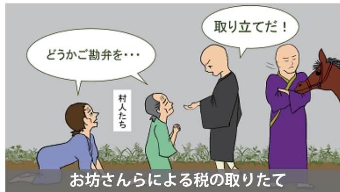
お坊さんらによる税の取り立て

挿絵を描き、初めてこの物語を知る方でも親しみやすく、わかりやすく読んでいただけるようにしました。