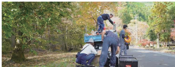
小来川のみらいをテラス会による設営の様子