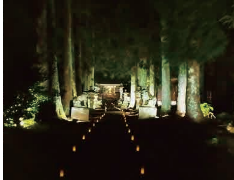
黒川神社の昼間の風景（左）とライトアップの様子（右）