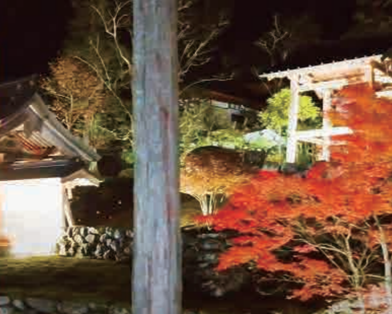
円光寺の昼間の風景（左）とライトアップの様子（右）